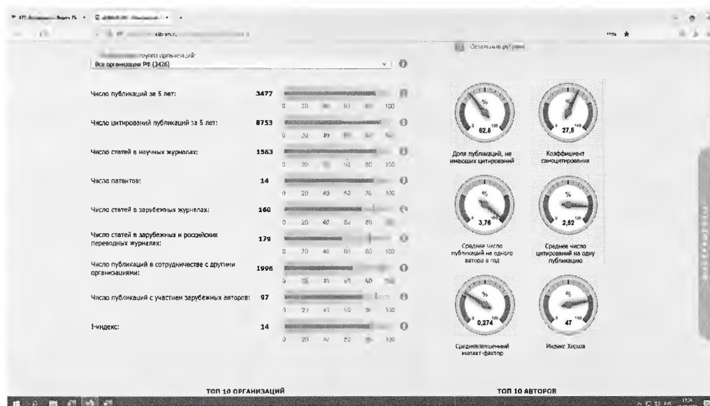
Рис. 1. Диаграмма. Показатели Института по публикационной активности

Среднее число публикаций на одного автора в год – 3,76 (3,62 – 2021; 3,2 - 2020); - коэффициент самоцитирования – 27,5 (28,8 - 2021, 36 - 2020); доля публикаций, не имеющих цитирования – 62,5 (63,2 -2021; 67,1 - 2020); среднее число цитирований на одну публикацию в год – 2,52 (2,26 -2021; 1,77 - 2020); средневзвешенный импакт-фактор журналов – 0,274 (0,305 – 2021; 0,276 - 2020), индекс Хирша – 47 (41 – 2021; 34 -2020), Рисунок 1.