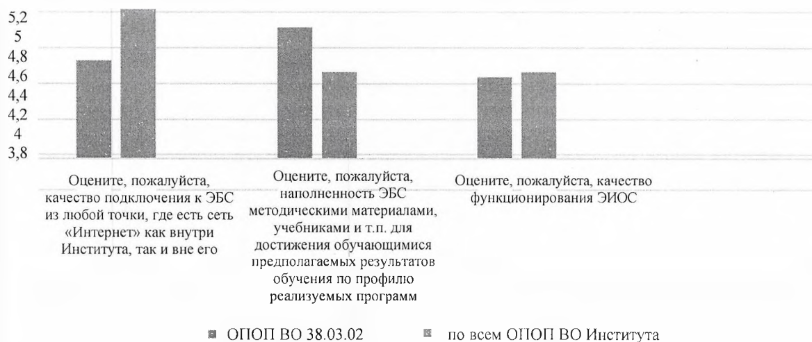
Рисунок 2 – Удовлетворенность преподавателей материально-техническим и учебно- методическим обеспечением образовательных программ

Удовлетворенность преподавателей материально-техническим и учебно-методическим обеспечением образовательной программы «Производственный менеджмент» по направлению подготовки 38.03.02 Менеджмент